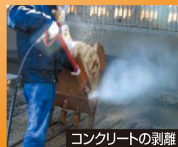
コンクリートの剥離